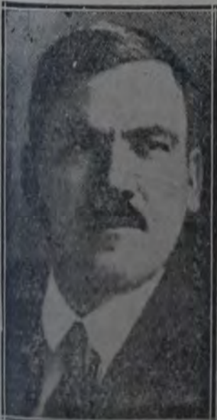
EL EX PRESIDENTE DE MEXICO, general Plutarco Elias Calles, que ha sido designado jefe de las fuerzas del gobierno que someterán a los sediciosos de Veracruz y Sonora. (Ver la información de la página 8).